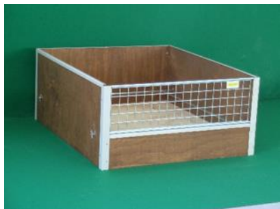
Wurfkiste aus Bootsbausperrholz für Hunde