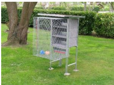
Voliere für 3 Taubenpaare