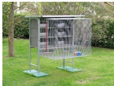
Voliere für 6 Taubenpaare

Sehr geehrter Kunde, vielen Dank, dass Sie ein FERRANTI Produkt gekauft haben.