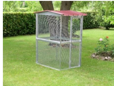
Voliere Modelle Modular

Sehr geehrter Kunde, vielen Dank, dass Sie ein FERRANTI Produkt gekauft haben.